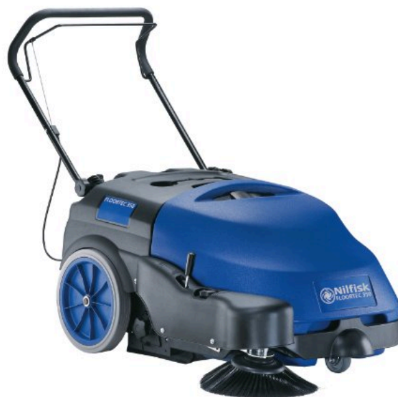
De getoonde afbeelding kan afwijken van het gekozen type